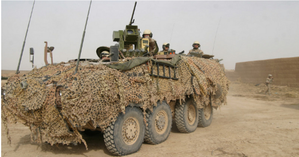
Blindé Mowag en Afghanistan. Photo: char danois

Afin de contourner la réglementation suisse déjà notoirement insuffisante, la Mowag n'a pas tardé à faire fabriquer ses blindés sous licence à l'étranger.