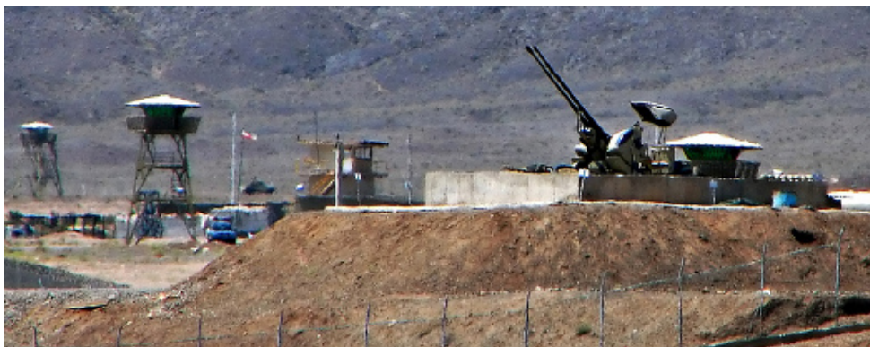
Canons antiaérien de Rheinmetall à Natanz, Iran, où se trouve une installation d'enrichissement d'uranium.

Oerlikon-Contraves, est une filiale du tristement célèbre consortium Oerlikon-Bührle. Elle fabrique entre autres de l' artillerie pour la défense antiaérienne et des munitions de calibre moyen. Outre la Chine et le Pakistan, elle a aussi équipé l'Iran. La firme appartient désormais au groupe allemand Rheinmetall Air Defence . Cette acquisition correspond à une tendance générale: la Mowag est devenue la propriété du consortium américain General Dynamics et d'autres entreprises d'armement ont également été achetées par des multinationales pour qui la guerre est en premier lieu une affaire profitable.