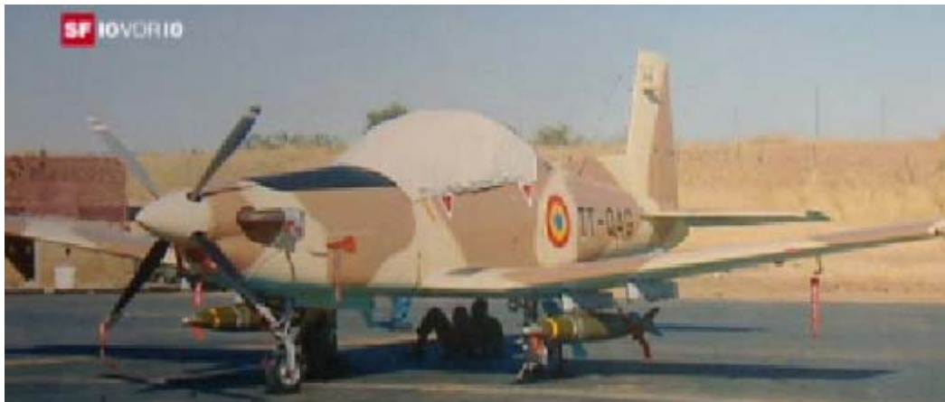
Avion Pilatus équipé de bombes, au Tchad.

Les usines Pilatus à Stans produisent, parallèlement aux jets privés civils, des avions légers militaires. Officiellement, ces engins sont utilisés pour les entraînements. L'initiative pour l'interdiction d'exporter du matériel de guerre veut interdire la livraison de ces avions militaires, qui finissent encore et toujours par être utilisés lors de combats. Les avions militaires Pilatus sont particulièrement utilisés pour lutter contre des soulèvements populaires. Le scandale le plus récent est celui de la livraison par la Suisse d'avions PC-9 au Tchad , où le régime en place n'a pas tardé à utiliser ces avions pour bombarder des populations en fuite avec des bombes à fragmentation . Au Chiapas également, des villages ont été bombardés par les avions Pilatus par l'armée mexicaine, faisant plusieurs centaines de victimes. Sur cette liste macabre se trouvent également la Birmanie , le Guatemala et l' Angola . Même les attaques au gaz toxiques de Saddam Hussein sur les kurdes d' Irak du Nord ont été réalisées à l'aide d'avions Pilatus.