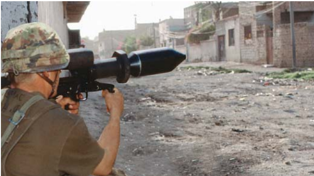
Lanceur anti-char, photomontage publicitaire de Ruag

La Ruag fabrique aussi, sur la base de plans israéliens, des petits avions sans pilotes: les drones . Aujourd'hui, ces appareils servent avant tout à des missions de surveillance, par exemple pour déterminer les prochaines cibles d'«homicides extra-judiciaires» dans les territoires palestiniens. En collaboration avec le consortium européen EADS, la Ruag développe aussi des drones qui pourront être équipés et engagés comme avions de combat.