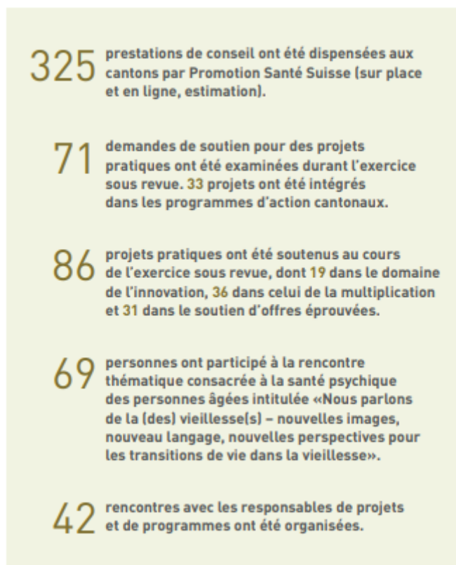
Figure 2 : mesures mises en œuvre en 2024 dans le cadre des PAC

Enfin, la fondation a renforcé son engagement en faveur de la promotion de la santé des personnes âgées dans les communes et les villes 14 , en élaborant un guide à cet effet. L'objectif est d'atteindre plus efficacement les personnes âgées et de les encourager à bouger davantage.