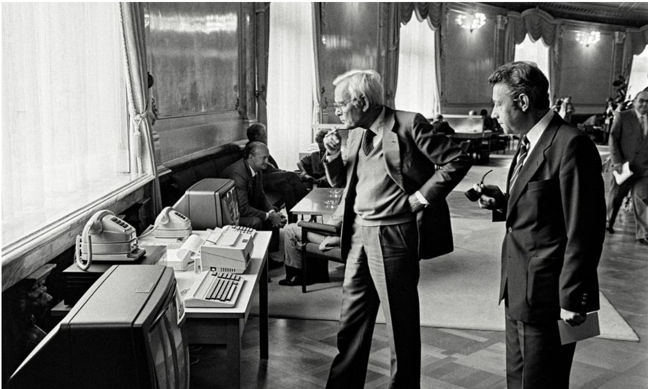
1984 wird in der Wandelhalle des Schweizer Parlaments die damals neuartige Computertechnik bestaunt.

Die Bundesversammlung beteiligt sich bis heute über die Parlamentsbibliothek aktiv an den Tätigkeiten des EZPWD sowie am Austausch darüber, wie den Ratsmitgliedern am besten sachdienliche Dokumentationen zur Verfügung gestellt werden können. Jedes Jahr beantwortet die Parlamentsbibliothek – mit der Unterstützung anderer Einheiten der Parlamentsdienste und der Bundesverwaltung – Anfragen aus dem EZPWD-Netzwerk. Sie erhält ausserdem hilfreiche Antworten auf ihre gezielten vergleichenden Umfragen im Netzwerk, und mehrere ihrer Mitarbeitenden konnten an thematischen Seminaren des EZPWD teilnehmen.