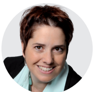
Isabelle Chevalley conseillère nationale Vert'lib/VD