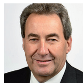
Heinz Siegenthaler, Nationalrat BDP, BE