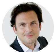
Guillaume Barazzone conseiller national PDC/GE