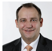
Thomas Matter, Nationalrat SVP, ZH