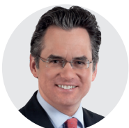
Olivier Feller conseiller national PLR/VD