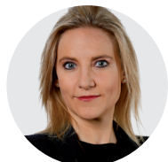
Céline Amaudruz conseillère nationale UDC/GE