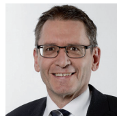
Pirmin Bischof, Ständerat CVP, SO