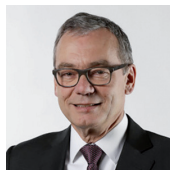
Ruedi Noser, Ständerat FDP, ZH