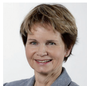
Brigitte Häberli- Koller, Ständerätin CVP, TG