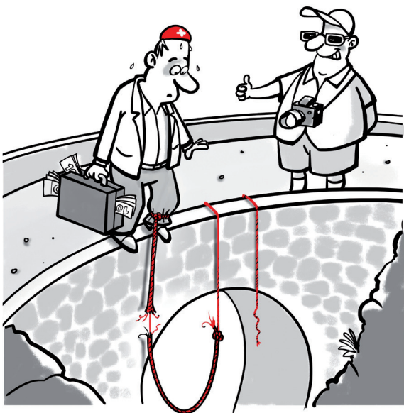
Vollgeld: ein hochriskanter Sprung ins Ungewisse

Heute sind die Guthaben auf Schweizer Konten sicher, weil wir auf ein stabiles Geldsystem zählen können. Mit Annahme der Initiative müsste die Schweiz dieses System radikal auf den Kopf stellen. Sie wäre damit das einzige Land der Welt, das seine Nationalbank zwingt, Geld ohne Gegenwert in Umlauf zu bringen. Ausserdem würde ein so krasser Systemwechsel mit Ansage den Schweizer Franken sofort zum Spielball von Spekulanten machen. Es gibt keinen Grund, warum die Schweiz ein solches Experiment mit riskantem Ausgang wagen sollte!