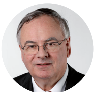
Jean-François Rime conseiller national UDC/FR