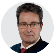
Jean-René Fournier conseiller aux États PDC/VS