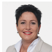
Daniela Schneeberger, Nationalrätin FDP, BL