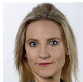
Céline Amaudruz, Nationalrätin SVP, GE