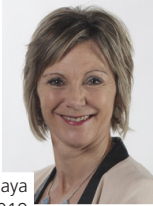
Graf Maya 2019