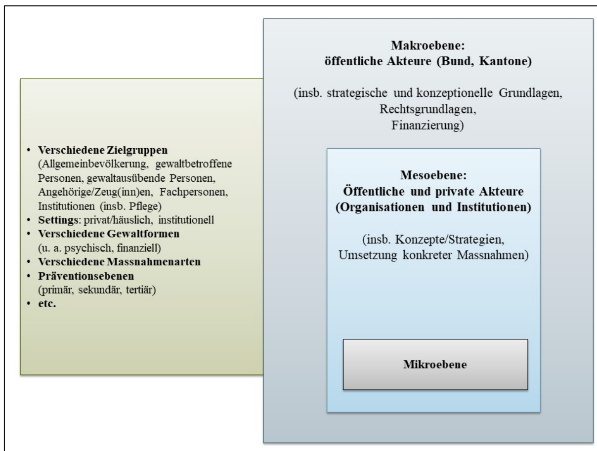
Abbildung 3: Systematische Darstellung der Präventions-, Erkennungs- und Interventionsmassnahmen in Fällen von Gewalt und Vernachlässigung im Alter